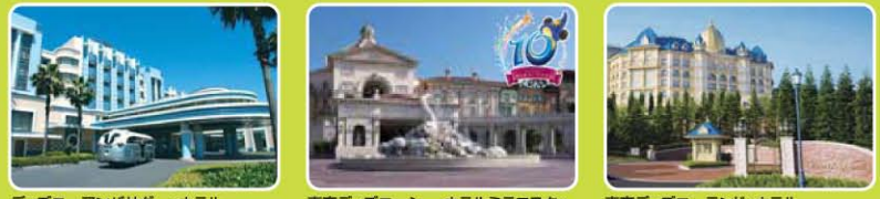
ディズニーアンバサダーホテル 東京ディズニーシー・ホテルミラコスタ 東京ディズニーランドホテル

※チェックイン当日および特別営業時間帯をご利用いただけません。(対象期間:2012年3月31日(土)まで)